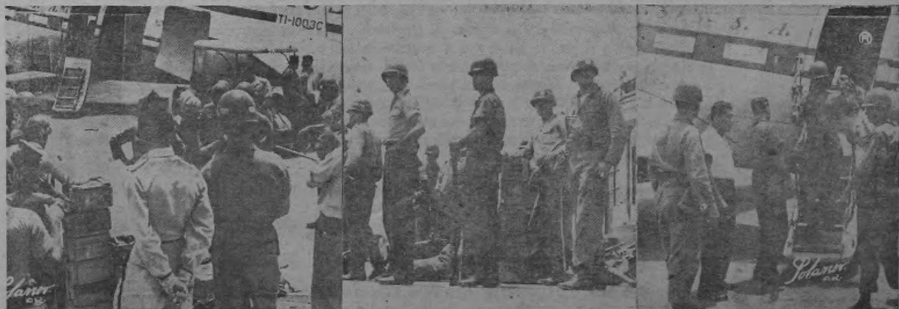
ARMAS Y PERTRECHOS DE GUERRA SON BAJADOS DEL AVION DE LACSA por miembros de la Fuerza Pública que estaban en las regiones del Sur del país alerta por posibles desórdenes de carácter comunista. Parte de las fuerzas regresan porque los jefes creen que no es necesario se mantenga allí un destacamento de envergadura. Sin embargo, las autoridades, que suministraron amplios detalles de una posible conjura roja aquí, se mantienen en estado de alerta para allegarse a cualquier sitio del territorio donde se produzcan brotes de violencia o simplemente amenazantes.