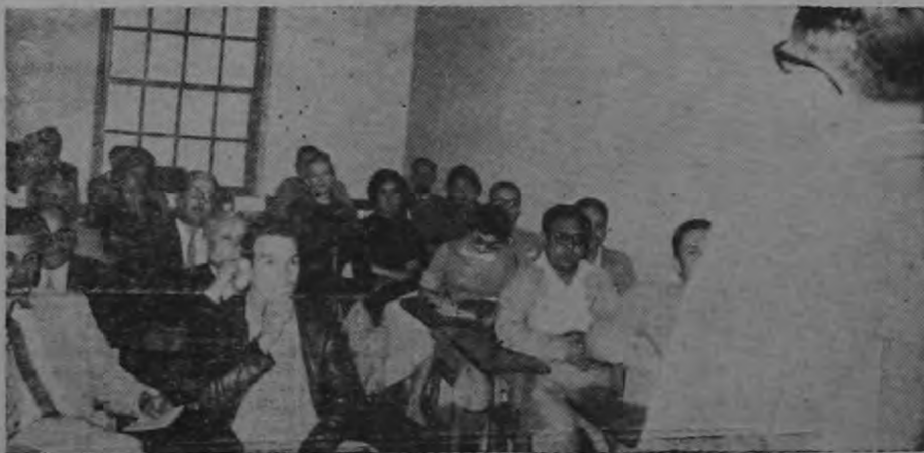
La gráfica de Meza fue tomada anoche durante la formidable exposición del Lic. Gonzalo Facio Segreda, en el Instituto de Ciencias Políticas sobre el tema: "Alcances y objetivos de la próxima conferencia Montevideo". Al lado, el Ex. Presidente Figueres, quien tuvo conceptos elogiosos para el conferenciante.